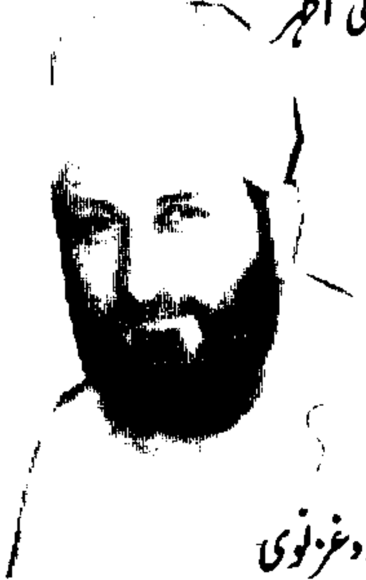
مولانا داؤد غزنوی